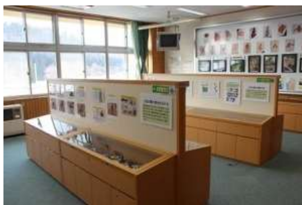
旧高松小学校校舎に開設された「ジオスタゆざわ」