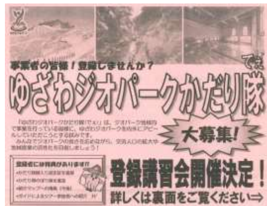
ゆざわジオパークかたり隊の募集