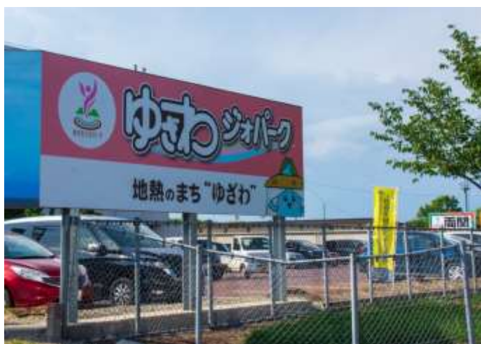
湯沢インターチェンジ入口に設置された総合案内看板

各種情報発信ツールを活用し、最新の情報を適切に発信することで、ゆざわジオパークの魅力を伝えていく必要があります。