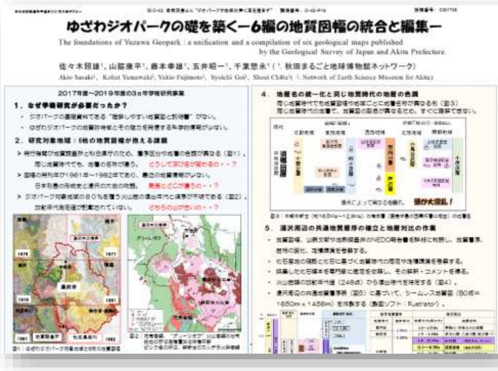
平成 29 年度の「地質図幅の統合と新知見」の学術研究ポスター

地質系1件、生態系1件、文化・教育系1件の計3件/年（予算額約60万円）とし、継続した調査・研究のテーマを厳選するなど、ゆざわジオパークの深化に役立てる必要があります。