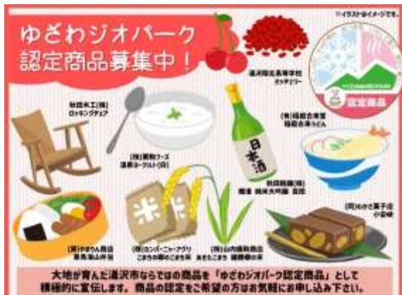
ゆざわジオパーク認定商品の募集