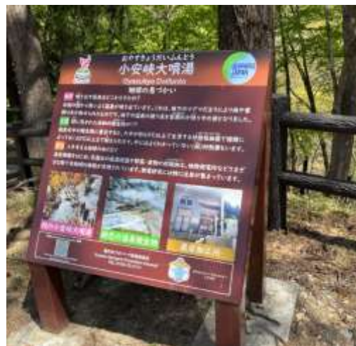
改訂されたジオサイト解説板