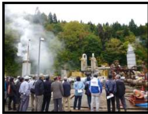
現地見学（上の岱地熱発電所）