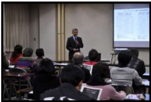
ガイド養成講座の座学の部

平成29年度（2017年度）以降、受講者が減少しています。新型コロナウイルス感染症流行に伴って、公開講座や講演会・シンポジウム、ジオツアーなどが実施できず、ジオパーク活動に対する市民の意識や行動が停滞しています。