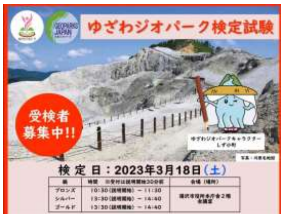
検定試験の案内ポスター